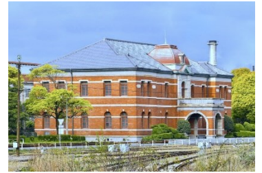
官営八幡製鐵所 日本事務所

ガイド場所としては常駐場所が 2 ヶ所あり、1 つは門司港レトロ地区、もう 1 つは世界遺産に登録されている官営八幡製鐵所（現日本製鉄）の施設眺望スペースで、各地区への割り当てによりほぼ毎日ガイドが常駐して対応します。その他にも観光客が多く訪れる GW や夏祭り時期など、小倉城周辺や城下町歩きなど臨時的観光案内所が設けられ詰めることがあります。また不定期に市の観光コンベンション協会へガイド依頼が入った時に、要請を受けて対応することもあります。