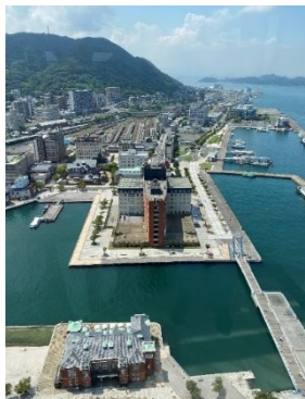
門司港レトロ展望室から見た眺望

北九州へ戻って久しぶりに会った元社同期の友人から、北九州市の観光案内ボランティアの話を知りました。友人も仕事は続けていますがフルタイムではなく、空いた日を活用してボランティアを始めたとのことでした。私も現在の業務をフルタイムにしなかったのは、趣味や地域活動などに組みたいと考えていたところだったので、興味を持ち詳しく話を聞いて早速動き出しました。生まれ育ちは三重県四日市ですが、第二の故郷と言っていいほど長く北九州市に住んでいながら、市のことについてはわずかな知識しか持ちあわせておらず、いつかもっと勉強したいと考えていたところだったので、これ幸いと飛びついた次第です。