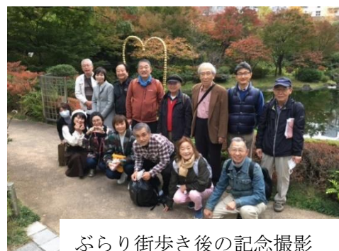
ぶらり街歩き後の記念撮影